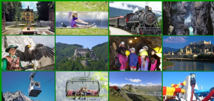
12 beliebte Ausflugsziele und dazu weitere 180 gern besuchte Highlights ...

Beim Kauf der SalzburgerLand Card für Ihre ganze Familie erhalten Sie 1 Erwachsenen-Karte als sehr wertvolles Urlaubsgeschenk für Ihre Sonnberg Erlebnistage! (23.06. - 01.09.2018)